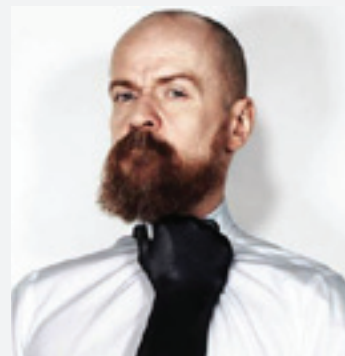
Alexander Bard Mänsklighetens fjärde revolution - Framtidsvisioner, trender, globalisering, teknologi

Bli inspirerad av över 30 kompetenshöjande seminarier med högaktuella, internationella talare. Läs hela det kostnadsfria seminarieprogrammet på easyFairs.com/EmpackSthlm